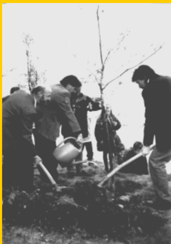
la posa dell'olmo

La valorizzazione degli spazi verdi e delle aree di svago rappresenta un obiettivo prioritario anche per l’Autorità comunale.”